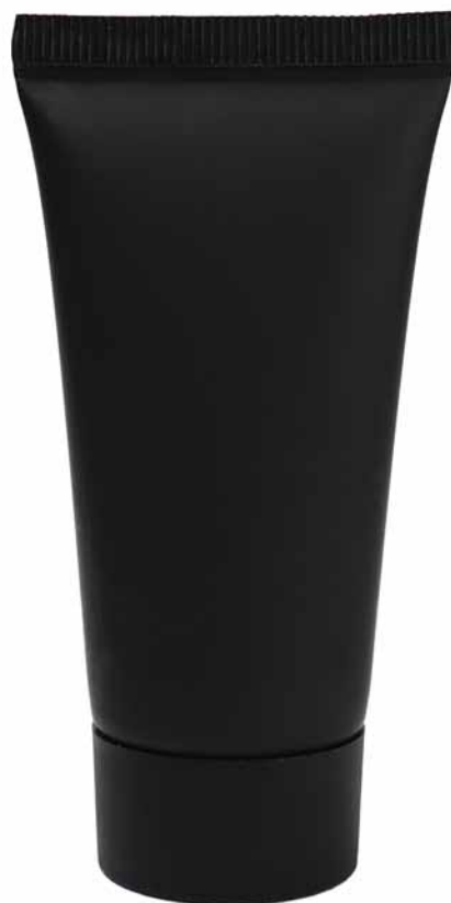
COD. 96100286 RIEMPITO A 30 ML