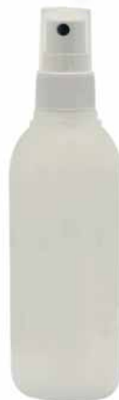
BOTTIGLIA 125 ML SEMI-TRASPARENTE CON SPRAY •125 ML SEMITRASPARENT BOTTLE WITH SPRAY •HALBDURCHSICHTIGE FLASCHE 125 ML MIT VERSTREUER •БУТЫЛОЧКА 125 МЛ ПОЛУПРОЗРАЧНАЯ С РАСПЫЛИТЕЛЕМ COD. 96100042+ 96100283

AREA DI STAMPA ETICHETTA 125 ml CIRCOLARE