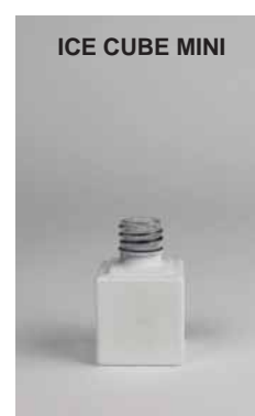
ICE CUBE MINI

COD. 96100385VNL FLACONE NERO •SHINE BLACK LACQUERING BOTTLE •GLASFLAKON IN SCHWARZ GLÄNZEND •ФЛАКОН ЧЁРНЫЙ БЛЕСТЯЩИЙ