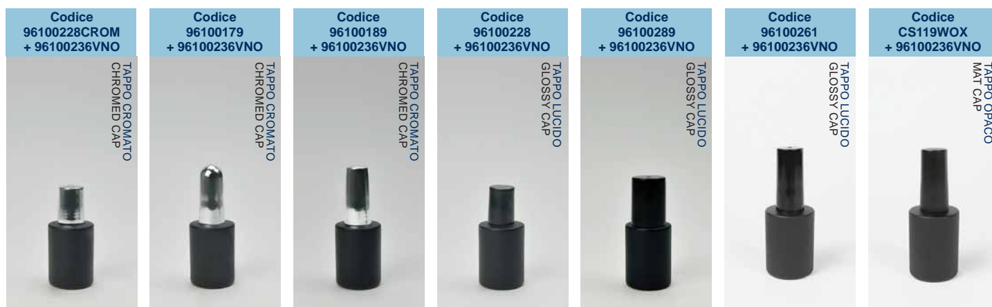
FLACONE CON VERNICIATURA NERO OPACO •MAT BLACK LACQUERING BOTTLE •GLASFLAKON IN SCHWARZ MATT •ФЛАКОН ЧЁРНЫЙ НЕПРОЗРАЧНЫЙ

Altezza 51.72 mm Capacità raso bocca 16.00 ml Diametro 28.70 mm Imboccatura 13-415 Peso vetro 25.00 g Sezione / Forma Cilindrica