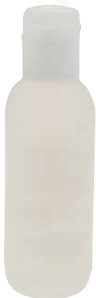
BOTTIGLIA 125 ML SEMI-TRASPARENTE •125 ML SEMITRASPARENT BOTTLE •HALBDURCHSICHTIGE FLASCHE 125 ML •БУТЫЛОЧКА 125 МЛ ПОЛУПРОЗРАЧНАЯ COD. 96100042+ 96100044