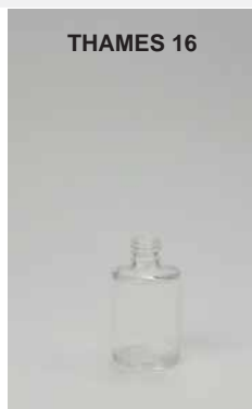
COD. 96100236 FLACONE TRASPARENTE •TRANSPARENT BOTTLE •DURCHSICHTIGER FLAKON •ФЛАКОН ПРОЗРАЧНЫЙ

FLACONE IN VETRO - BOCCA 13 GLASS BOTTLE – MOUTH 13/ ФЛАКОН ИЗ СТЕКЛА – ГОРЛЫШКО 13 MM CAPACITÀ MASSIMA 16 ML MAXIMUM CAPACITY/MAX. KAPAZITÄT/ВМЕСТИМОСТЬ