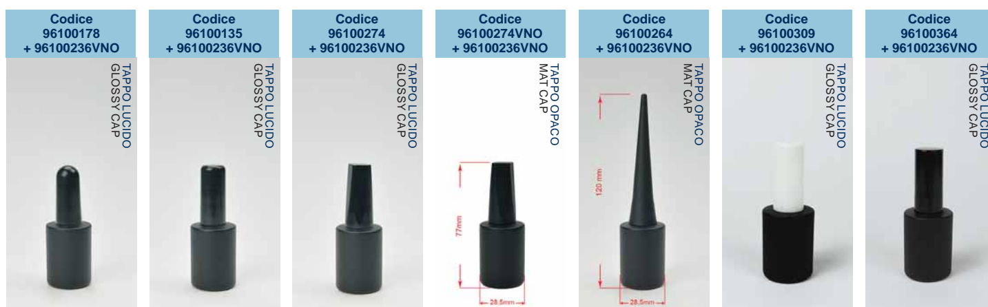
FLACONE CON VERNICIATURA NERO OPACO •MAT BLACK LACQUERING BOTTLE •GLASFLAKON IN SCHWARZ MATT •ФЛАКОН ЧЁРНЫЙ НЕПРОЗРАЧНЫЙ