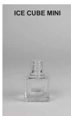
ICE CUBE MINI

FLACONE IN VETRO - BOCCA 13 GLASS BOTTLE – MOUTH 13/ ФЛАКОН ИЗ СТЕКЛА – ГОРЛЫШКО 13 MM CAPACITÀ MASSIMA 7 ML MAXIMUM CAPACITY/MAX. KAPAZITÄT/ВМЕСТИМОСТЬ