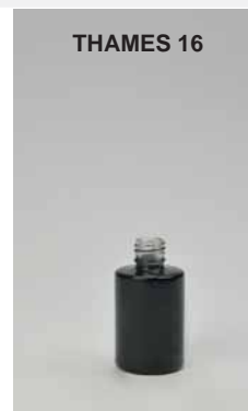
COD. 96100236VNL FLACONE CON VERNICIATURA NERO LUCIDA •SHINE BLACK LACQUERING BOTTLE •GLASFLAKON IN SCHWARZ GLÄNZEND •ФЛАКОН ЧЁРНЫЙ БЛЕСТЯЩИЙ

Altezza 51.72 mm Capacità raso bocca 16.00 ml Diametro 28.70 mm Imboccatura 13-415 Peso vetro 25.00 g Sezione / Forma Cilindrica