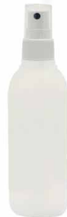
BOTTIGLIA 125 ML BIANCA CON SPRAY •125 ML SEMITRASPARENT WHITE BOTTLE WITH SPRAY •WEISSE FLASCHE 125 ML MIT VERSTREUER •БУТЫЛОЧКА 125 МЛ БЕЛАЯ С РАСПЫЛИТЕЛЕМ COD. 96100162+ 96100283