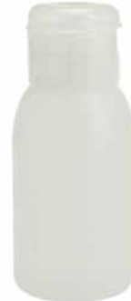
BOTTIGLIA 50 ML SEMI-TRASPARENTE •50 ML SEMITRASPARENT BOTTLE •HALBDURCHSICHTIGE FLASCHE 50 ML •БУТЫЛОЧКА 50 МЛ ПОЛУПРОЗРАЧНАЯ COD. 96100268

TAPPO •CAP •DECKEL •КРЫШКА COD. 96100269