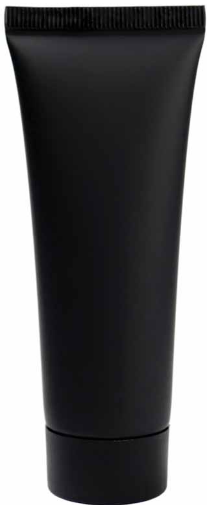
COD. 96100286 RIEMPITO A 50 ML